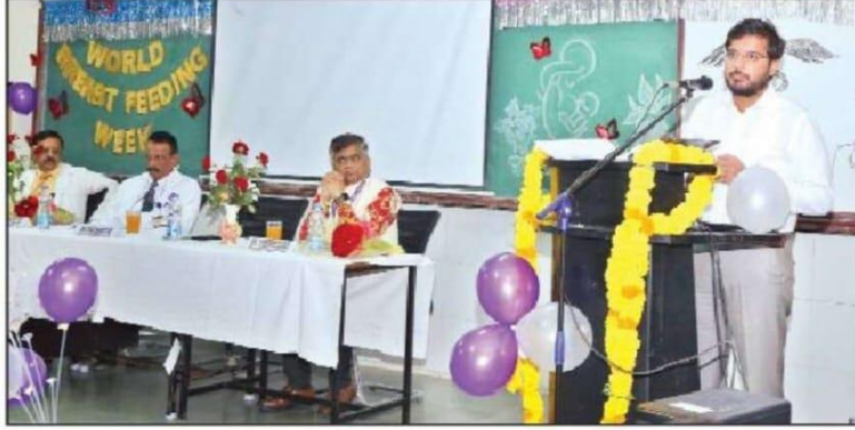
వారోత్సవాలలో ప్రశాంగిస్తున్న కడ ఎస్ టి