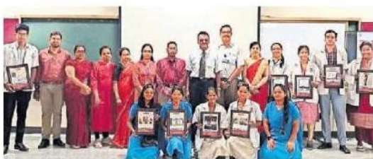
రక్తదాన శిబిరంలో పాల్గొన్న ప్రముఖులు, విద్యార్థులు