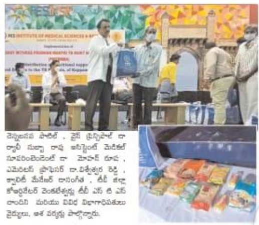
Distribution of Nutritional Support (Food Baskets) to TB Patients of Kuppam Constituency